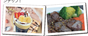
コバヤシクレープ パナナチョコ ハイサイカフェ 有機野菜とサーロインステーキ丼

日本最大級プラットフォーム「Mellow」が選んだ5台のキッチンカーが、この日のために腕を振ります。お肉派も、甘党も、ヴィーガン派も満足できるラインナップ!