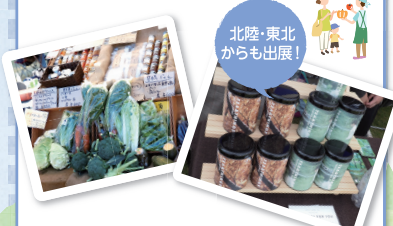
※写真はイメージです。 フルーツハーブティ

日本各地の名産品や美味しい秋の味覚、環境に優しい雑貨・小物が一挙に揃う循環型マーケットを開催。